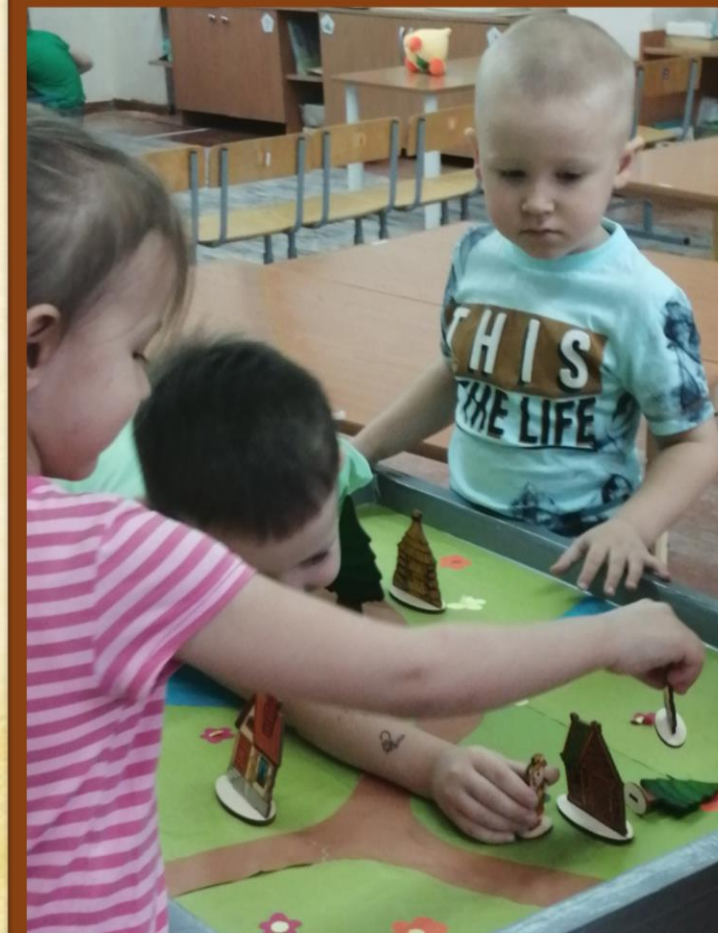
Театрализация Сказка «Три поросенка»