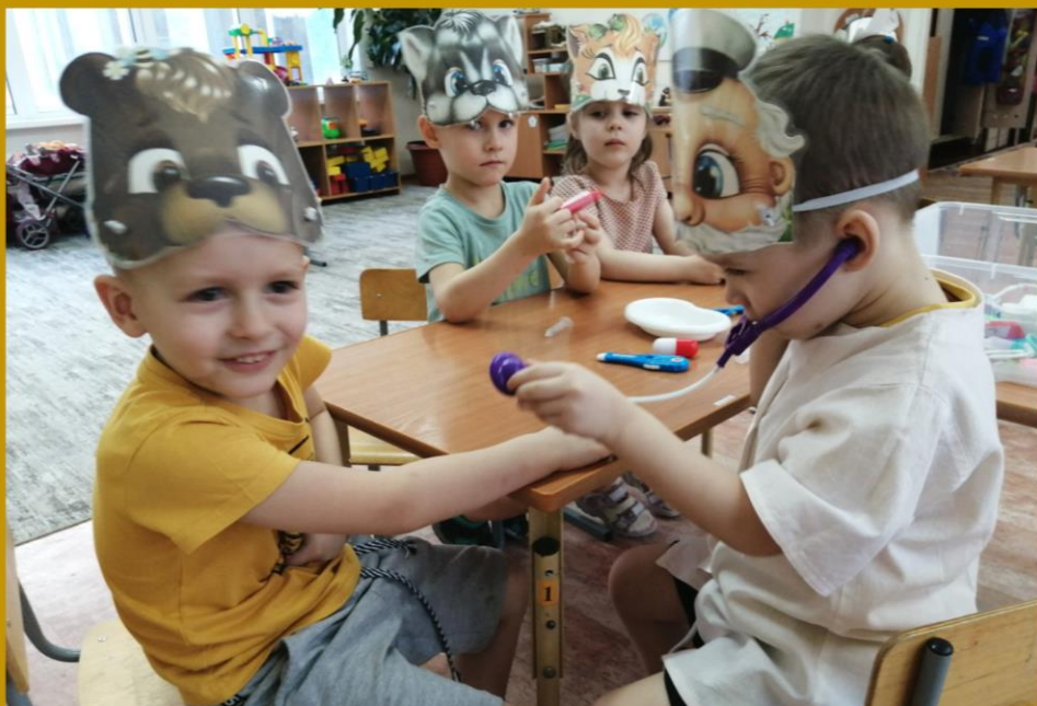
Сюжетная игра. «Добрый доктор -ролеАйболит...»