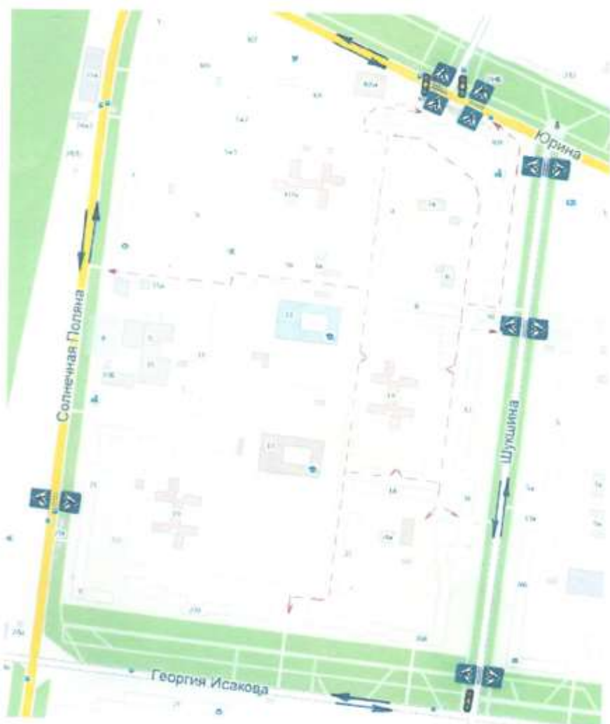
Схема организации дорожного движения в районе МБДОУ ЦРР – «Детский сад №179 «Рябинушка», расположенного по адресу ул. Шукшина,14 в квартале, ограниченном ул. Шукшина, ул. Г. Исакова, ул. Солнечная поляна, ул. Юрина.